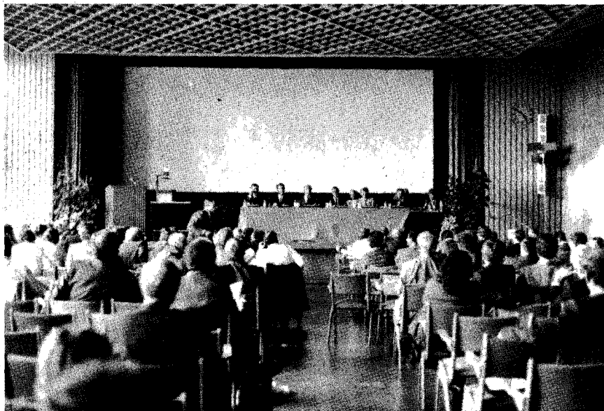
Viele Interessierte bei der Metamizol-Anhörung

bundesdeutschen Markt. Aber dieser Schmerzkiller bringt seinen Umsatz in Ländern der Dritten Welt. In Lateinamerika und Indien sind NOVALGIN und BARALGIN gar Umsatzträger Nr. 1. Über 40% der Erlöse von Hoechst Indien stammen aus dem Geschäft mit diesen beiden metamizolhaltigen Arzneimitteln. In Lateinamerika ist NOVALGIN das meistverkaufte Markenarzneimittel überhaupt! Allein dort erzielt Hoechst bereits 45% des Weltumsatzes mit NOVALGIN. Man kann also sicher davon ausgehen, daß Hoechst mehr als die Hälfte der 227 Millionen, die NOVALGIN und BARALGIN im Jahr (1984) bringen, in der Dritten Welt einnimmt. Hinzu kommt, daß viele andere Pharmafirmen Metamizol als Feinchemikalie von Hoechst beziehen und diese zu den bedeutendsten Grundstoffen gehört, die Hoechst verkauft.